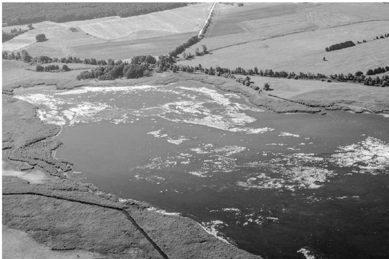
Natura-2000-Gebiet – Rietzer See, Stiftung NaturSchutzFond

Das Projekt der Stiftung NaturSchutzFonds Brandenburg wird gefördert durch den Europäischen Landwirtschaftsfonds für die Entwicklung des Ländlichen Raumes (ELER). Verwaltungsbehörde ELER: www.eler.brandenburg.de . Kofinanziert aus Mitteln des Landes Brandenburg.